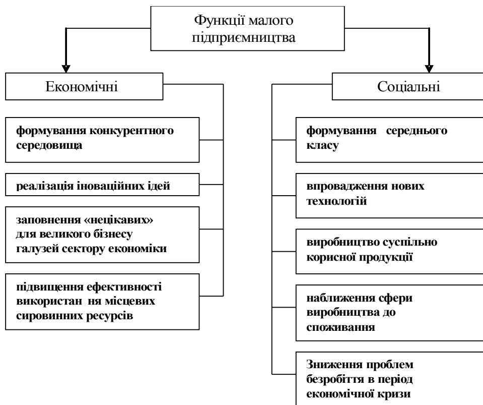
Рис 3. Функції малого бізнесу

Для ефективного управління розвитком територіальної громади необхідна інформаційна підтримка. Таку інформацію покликана надавати система моніторингу, яка виявляє і систематизує данні про зміни, що відбуваються на відповідній території спостереження та про середовище її функціонування. Саме таку систему доцільно використовувати при вивченні становища малого бізнесу.