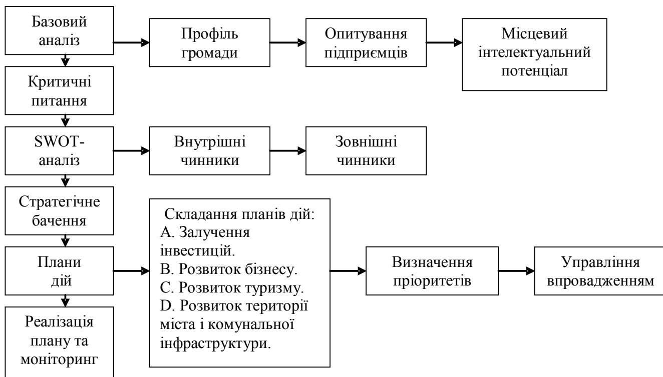
Рис 1. Блок-схема процесу стратегічного планування економічного розвитку

співпраці з проектом «Економічний розвиток міст» Агентства США з міжнародного розвитку (USAID), радники якого виконували функції консультантів Експертного комітету з економічного розвитку. У результаті проведеної роботи було розроблено план заходів, який графічно зображений у вигляді схеми (рис 1) [3].