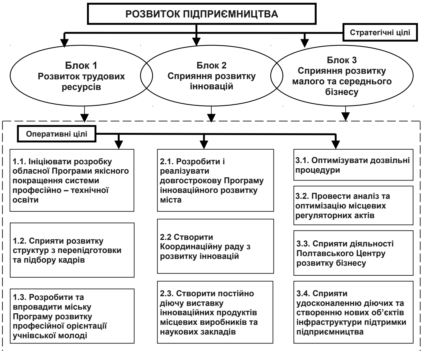
Рис. 2. Стратегія розвитку підприємництва міста [3].

До стратегічних цілей розвитку підприємництва в м. Полтава можна включити такі блоки (рис.2):