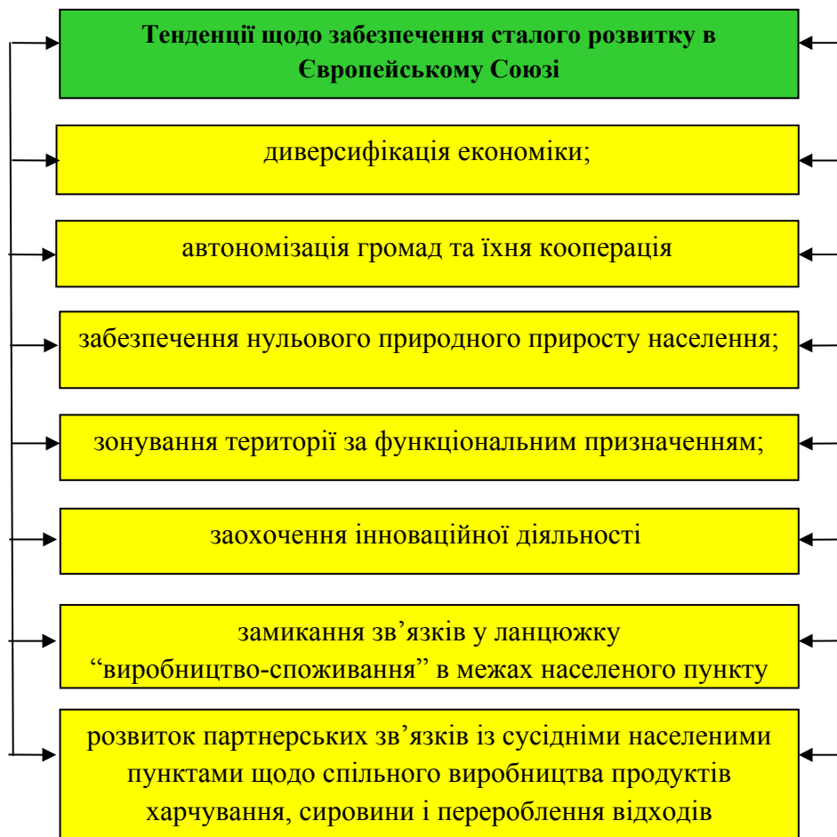
Рис. 1.3. Тенденції щодо забезпечення стійкого розвитку у країнах Європейського Союзу

Отже, у загальному у країнах ЄС можна виділити такі тенденції щодо забезпечення сталого розвитку на рівні громад (рис. 1.3.):