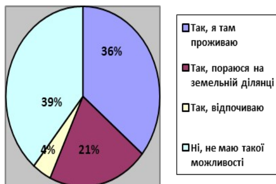
Рис.2. Скажіть, будь ласка, чи часто ви виїжджаєте в сільську місцевість для відпочинку?

Величезний відсоток людей, навіть не знають про поняття зеленого туризму, тому, аналізувати відповіді на питання розвитку його у майбутньому, здається, не доцільним.