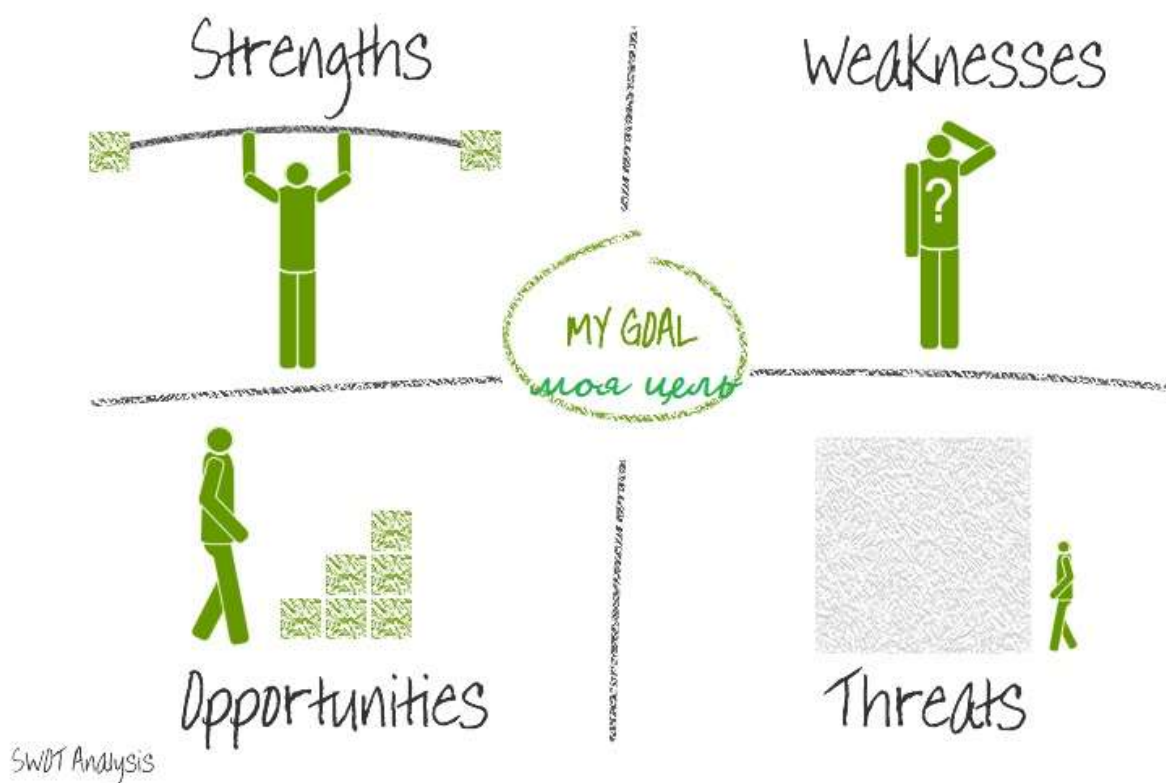
Мал.1 Логічно-структурна схема SWOT-аналізу.

Результатом SWOT-аналізу, спрямованого на формування узагальненого інформаційного потенціалу, повинні з'явитися ефективні рішення, що стосуються відповідної реакції (впливу) суб'єкта (слабкої, середньої й сильної) відповідно до сигналу (слабкого, середнього або сильного) зовнішнього середовища (мал.1).